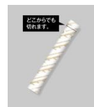
食べられる米ぬか